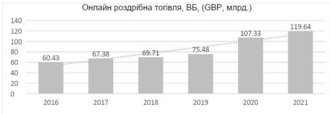
Рисунок 1 - Динаміка росту ринку електронної комерції в Великобританії