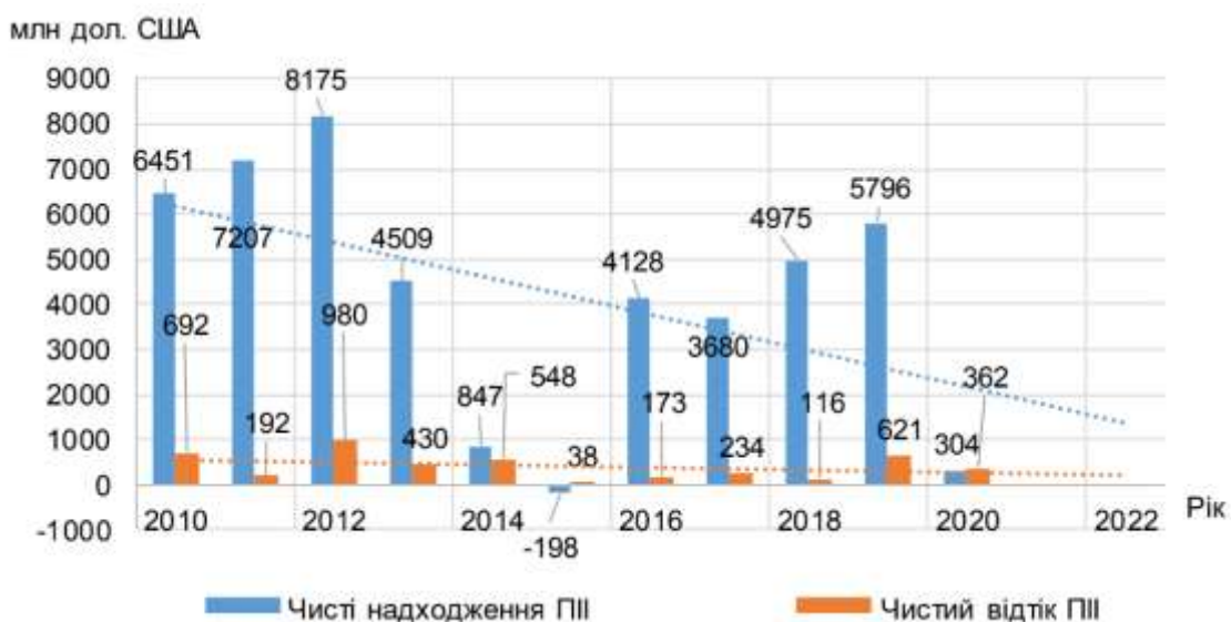
Рисунок 1 – Динаміка чистих надходжень та відтоку прямих іноземних інвестицій в економіку України та з України впродовж 2010-2020 років

За трактування Міністерства фінансів України прямими іноземними інвестиціями вважаються довгострокові вкладення матеріальних засобів компаніями – нерезидентами в економіку країни [1]. Надходження іноземних інвестицій до економіки є однією з рушійних сил її розвитку, тому для України наявність та зростаюча тенденція до іноземних довгострокових вкладень в економіку є досить позитивним явищем та особливо актуальним в сучасних умовах.