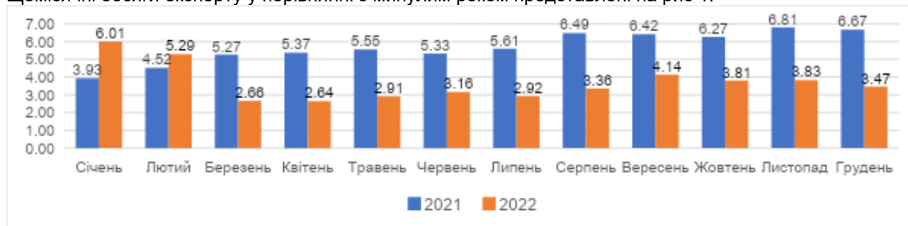
Рисунок 1 – Загальний обсяг експорту України за 2021 та 2022 роки, млрд дол. США

Але варто підкреслити, що йдеться про країну, яка веде війну за власне існування. І те, що Україна зберегла потенціал низки підприємств, які виробляють товари, привабливі для світового ринку, і не ввела повне обмеження на переміщення товарів і сировини, є неабияким досягненням. Не зважаючи на зменшення обсягу експорту, результати як для умов воєнного часу – позитивні [2]. Щомісячні обсяги експорту у порівнянні з минулим роком представлені на рис 1.